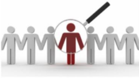
İnsan kaynağı yapılanması

E-ticaret mağazanızı oluşturmak için ihtiyaç duyacağınız tüm çalışmalarda yol haritanızı sizinle birlikte belirliyor ve bu yolda sizinle kolkola yürüyoruz.