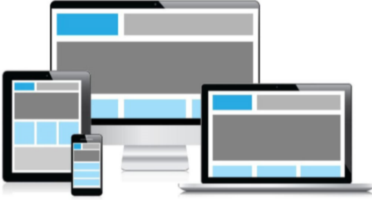
Mobil uyumlu ve kullanıcı dostu arayüz