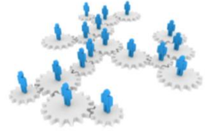
Sektörel analizler ve bilgi paylaşımı