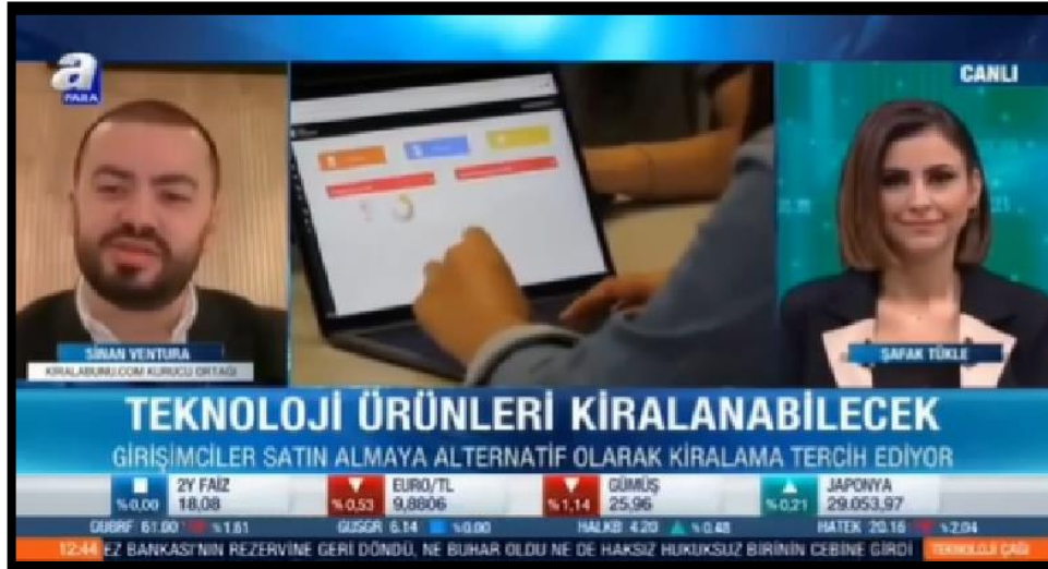
Kiralabunu – A Haber