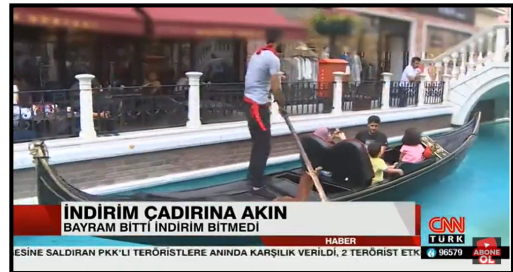
Venezia Mega Outlet - CNNTürk