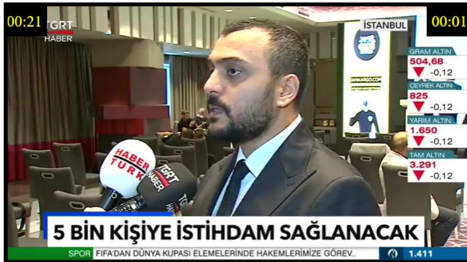
GKN Kargo