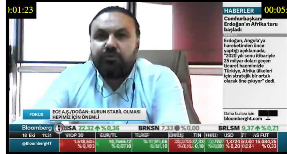
Ece Piknik - BloombergHT